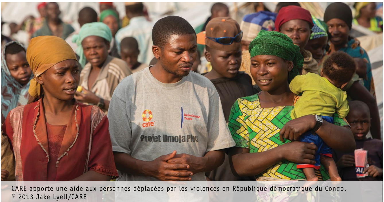
CARE apporte une aide aux personnes déplacées par les violences en République démocratique du Congo.

En partant des 70 ans d'expérience de CARE en matière de lutte contre la pauvreté et d'action humanitaire, de notre analyse des stratégies qui apportent des changements positifs, ainsi que de notre engagement total à s'attaquer aux les principaux facteurs qui restreignent l'exercice des droits humains – notamment ceux des femmes et des