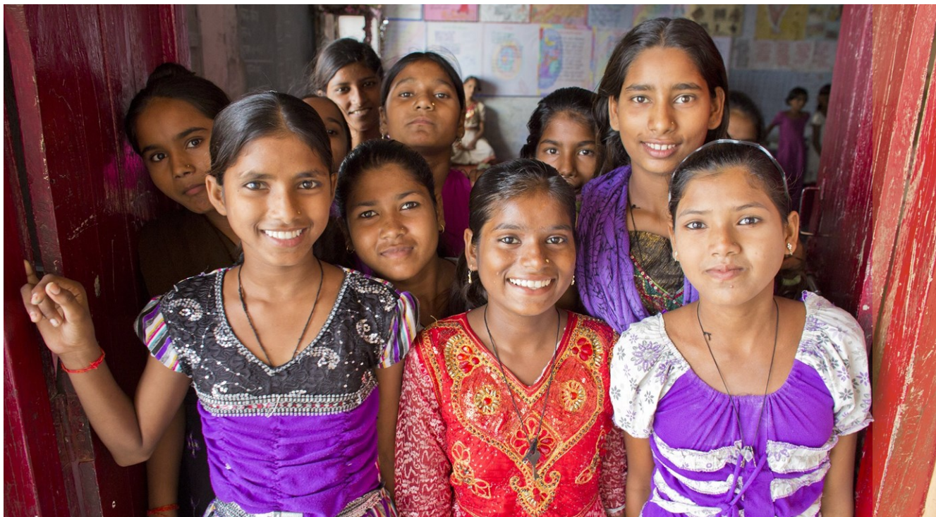
Les programmes de CARE Inde se concentrent sur l'empowerment des femmes et filles.